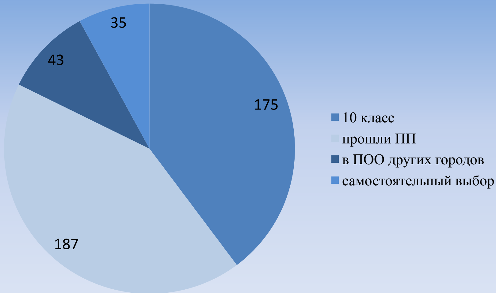
Диаграмма профессионального выбора обучающихся 9-го класса г. Осинники